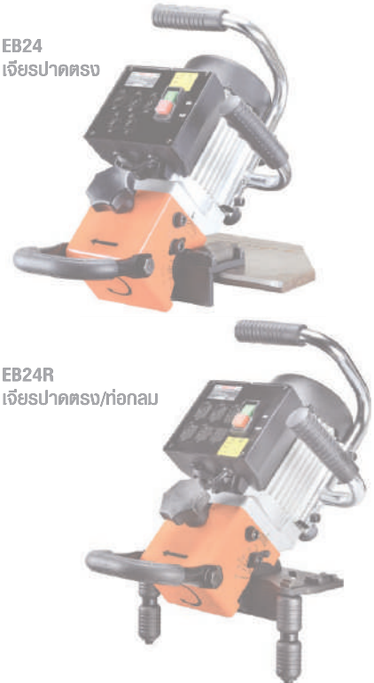
EB24R เจียปาดตรง/ท่อนกลม