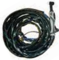
ชุดสายเชื่อมทิก (TIG Torch)

I101-IOW6305-32 WP26-7.6 สำหรับรุ่น TIG-160MT, TIG-160T, TIG-185MT, TIG-200MT, TIG-200P, TIG-200PACDC, TIG-200T, TIG-225MT, TIG-225T,