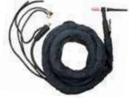
ชุดสายเชื่อมทิก (TIG Torch)

WP17-4m สำหรับรุ่น KT-M022-P01029 สำหรับรุ่น CMT