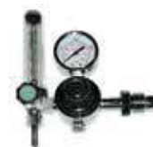
เกจวัดแรงดันอาร์กอน (Argon Regulator)