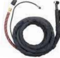
ชุดสายเชื่อมทิก (TIG Torch)

I101-IOW6305-32 WP26-7.6 สำหรับรุ่น TIG-160MT, TIG-160T, TIG-185MT, TIG-200MT, TIG-200P, TIG-200PACDC, TIG-200T, TIG-225MT, TIG-225T,