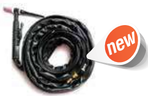
ชุดสายเชื่อมทิก ค้ำดำ (TIG Torch)

H NEW สวิตช์ I101-IHQ0006 WP-26 สวิตช์ (ตัว)