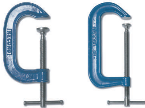
General Purpose 120

เป็นแคลมป์ที่แข็งแรงที่สุดที่เหมาะกับการใช้งานที่ต้องการแรงบีบจับที่ต้องใช้แรงมาก เช่น งานประกอบโลหะ