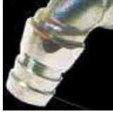
ปากก๊อกสวมสายยาง ได้ในตัวรุ่นประหยัด สำหรับการใช้งาน นอกตัวอาคาร(ก๊อคน้ำ)