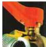
Strong and durable with PUT UP LOCKED technique