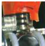
ระบบซิล 2 ชั้น ในมินิบอลวาล์ว Double seal-higher leakage protection