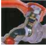
เทคนิคการประกอบ แบบสล็อกแกนทำให้แข็งแรง ทนทานต่อการรั่วซึม