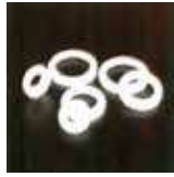
ซีลทฟลอน(Teflon)แท้ ทำให้ไม่รั่วซึม ใช้งานได้นาน