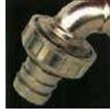
ปากก๊อกสวมสายยาง ได้ในตัวรุ่นประหยัด สำหรับการใช้งาน นอกตัวอาคาร(ก๊อกลมน้ำ)