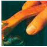
ด้ามจับขนาดเหมาะมือ ทนทานต่อการเปิดปิด