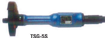
TSG-5S • 5" STRAIGHT GRINDER