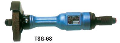
TSG-6S • 6" STRAIGHT GRINDER