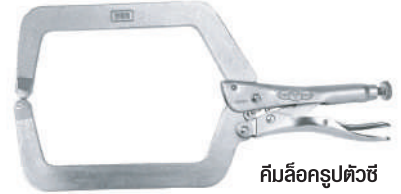
คีมล็อครูปตัวซีคอลึกพิเศษ