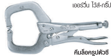
คีมล็อครูปตัวซี