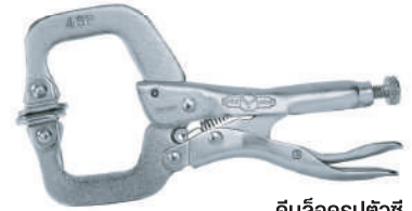
คีมล็อครูปตัวซีมีแผ่นรองหน้าสัมผัส