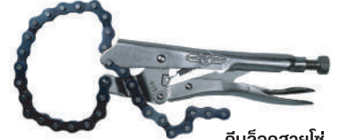
คีมล็อคลายโซ่