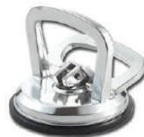
(8128-1 :แบบหัวจับเดี่ยว)