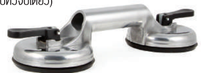
(8128-2 : แบบหัวจับคู่)