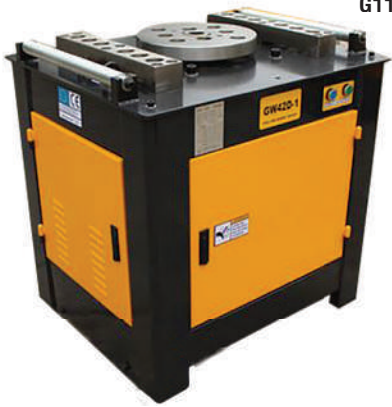
เครื่องดัดเหล็ก G111-GW42D-1