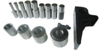
อะไหล่ร่องแกน G112-GQ42D-1042 G112-GQ42D-4048