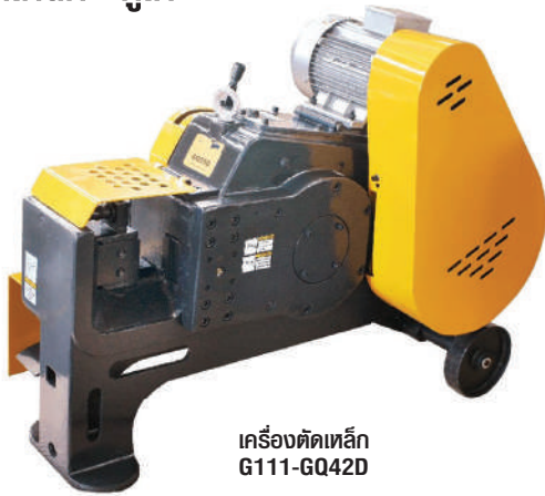
เครื่องตัดเหล็ก G111-GQ42D