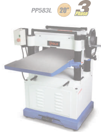
PP583L 20" 3 Phase