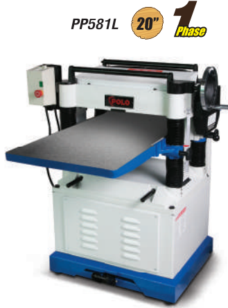
PP581L 20" 1 Phase