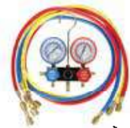
เกอวิตแรงดัน + สายน้ำยา