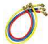
สายน้ำยา