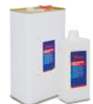
น้ำมันบีบสุญญากาศ