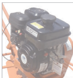
เครื่องยนต์ SUBARU EX17-0D