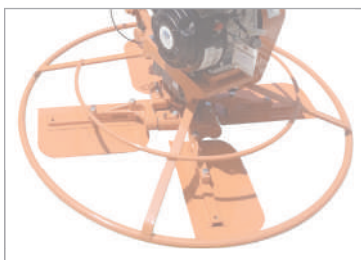
ใบขัด 4 ใบ