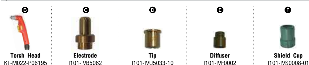
Torch Head KT-M022-P06195