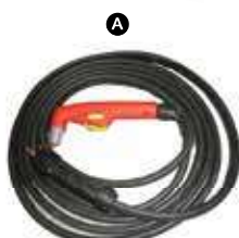
KT-M022-B29122 ยาว 6m