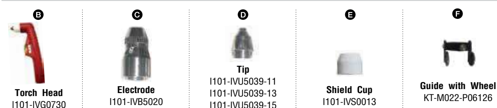
Torch Head I101-IVG0730