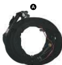
I101-IVT0985-100 ยาว 5m