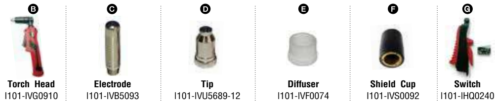
Torch Head I101-IVG0910