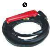
I101-3010 ยาว 5m