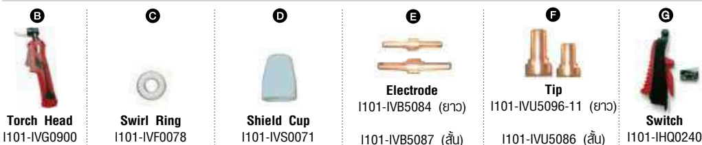
Torch Head I101-IVG0900