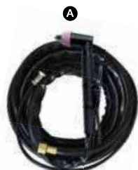
KT-M022-P03019-1 ยาว 5m