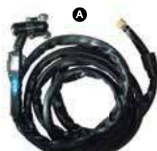
KT-M022-P03008 ยาว 5m