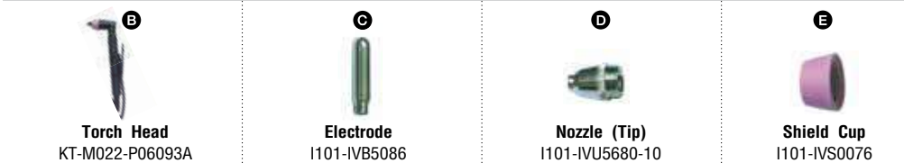
Torch Head KT-M022-P06093A