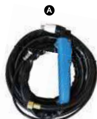
I101-3020 ยาว 5m