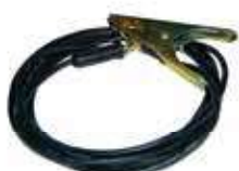
KT-M022-P03001 ยาว 4m