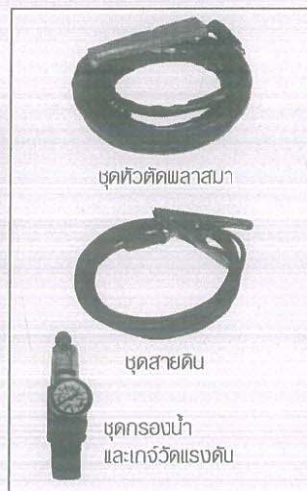
ชุดหัวตัดพลาสมา