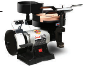
มอเตอร์หินไฟ 5"