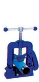
Pipe Vice V-1